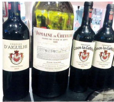
Preziosen aus dem Portfolio von Graf von Neipperg und Domaine de Chevalier